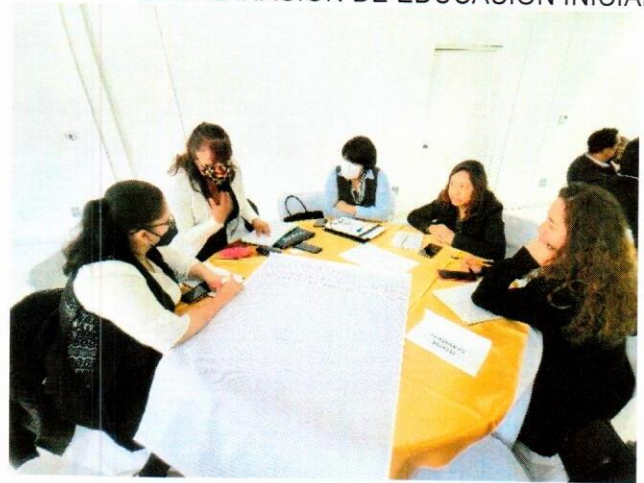
Presentando las propuestas estatales de cada área sobre la Política nacional de Educación Inicial