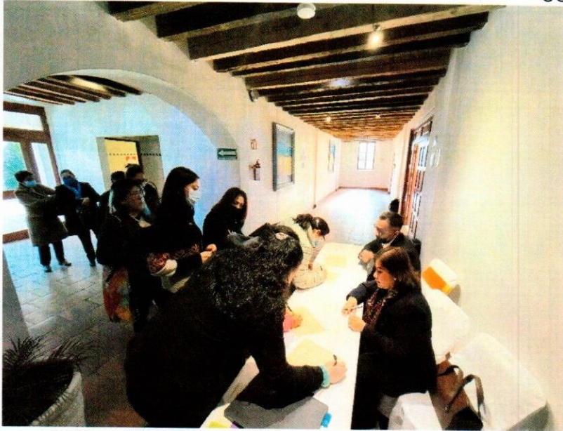
Registro de asistentes