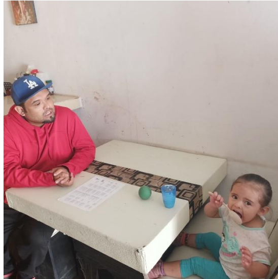
Municipio: Tepetitla de Larzibal